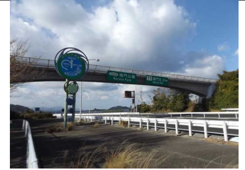
側面 (神戸側より撮影)