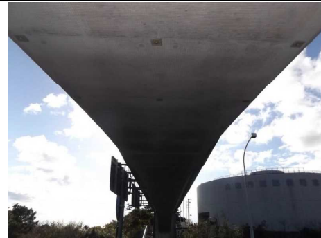
桁下面 (A1側より撮影)